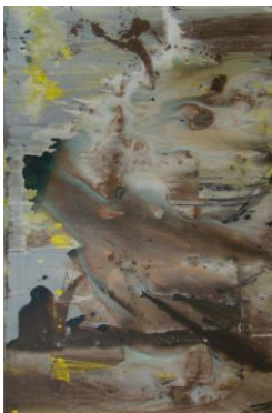
李磊 《风满云头花满天》 布上丙烯 150x100cm 2012

《心与识 - 李磊的抽象艺术》即将于 2013 年 3 月 9 日起，于上海思南公馆龙门雅集拉开展览序幕。此展将呈现李磊完成于 2012 年以“云水间”系列、“风满云头花满天”、“暗风催红香凝袖”、“关山不知云中君”等作品为主轴的 10 幅新作与 12 幅粉彩纸上素描作品；此展也同时回顾性地精选了 10 幅李磊于 2006-2011 年间先后完成的代表作如“水调歌头”、“乱花飞”、“吉祥九重天”等，具体而微地展现李磊 2006 年至今汲汲专注经营的抽象艺术创作成果，引领我们走入他一向追求的纯粹和诗意抽象之境。