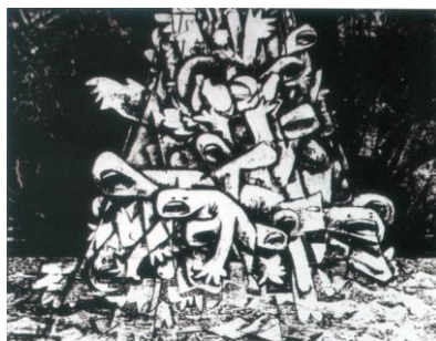
李磊 《地狱变之一》 丝网版画 60x70cm 1987