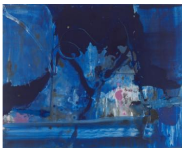
李磊 《云水间 No. 16 夜长箫三更秋》 布上 丙烯 80x100cm 2012

此时，李磊的绘画正逐步领悟所谓中国抽象艺术的特点。中国的抽象画家，几乎无一例外都是从具象画家经历了长期艰苦探索，才完成形式的转换过程而走向抽象艺术的。李磊也同样如此。他曾说：“抽象画创作源自画家内在需要，旨在传达画家内在经验的真相与探索内在世界的奥秘。我把中国传统文化的理解融会在作品里，思考问题方式也是东方的。我的创作，借鉴了东方传统哲学概念和艺术形式，以及密不透风疏可走马间的虚实对比，黑与白都是相生相应的。”