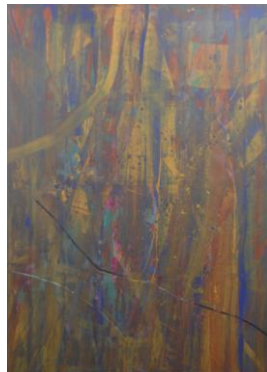
李磊 《水调歌头 No. 3》 布上丙烯 250x180cm 2009