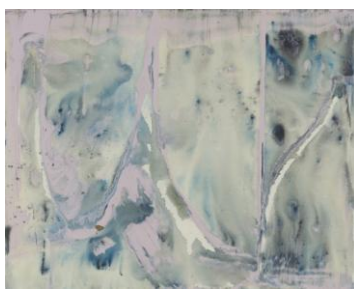
李磊 《云水间 No. 09 花自醉》 布上 丙烯 80x100cm 2012