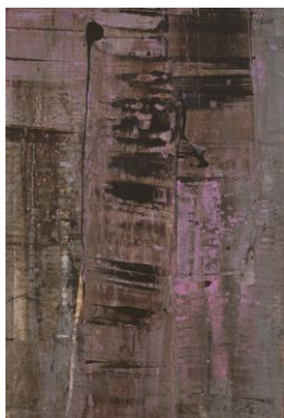
李磊 《醉湖之昨夜漫舞醉桃花》 布上 丙烯 150x100cm 2006

李磊 1996 年开始进入抽象艺术探索领域，尝试寻求将个体生命特质转向抽象化表达。他逐渐去除画面上所见寻常事物外形，加强抒发感情内涵的抽象形式与笔法运用。追求艺术表现的变化，但又不截断与过去经验的联系。