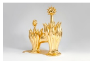
黄致阳 祥兽之八 黄铜 纯金箔 2013 W39x D17xH51cm Huang Zhiyang Auspicious Beast no. 8 Brass, Pure Gold leaf