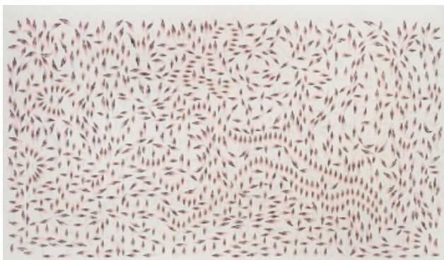
黄致阳 千灵显-游聚之一 墨 矿物彩 绢布 2013 120 x 220cm Huang Zhiyang Three Marks - Wandering and Gathering No.1 Chinese ink & mineral color on tough silk