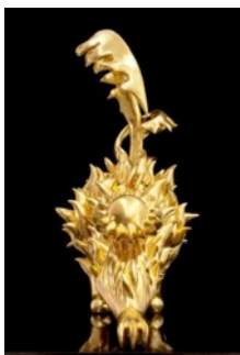
黄致阳 祥兽之三 3 黄铜 纯金箔 2013 W89xD58xH100cm Huang Zhiyang Auspicious Beast no. 3 Brass, Pure Gold leaf

媒体联系： press@longmenartprojects.com | T: +86 21 64722838 | F: +86 21 64721258 杨洁 chloe@longmenartprojects.com 李俊毅 jeff@longmenartprojects.com 张佩慧 jaco@longmenartprojects.com