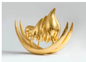
黄致阳祥 兽之六 黄铜 纯金箔 2013 W39xD9xH29cm Huang Zhiyang Auspicious Beast no. 6 Brass, Pure Gold leaf